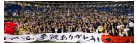
パールボウルに参戦いただいたファンの皆さんと共に

できた遂行力、相手のピックプレーを得点までには結びつかなかった集中力が、勝利を引き寄せました。いずれにしても、ドイツ遠征モナークス戦も含めた5試合を勝ち取り、パールボウル優勝という2012春シーズンの目標を達成できたことは、チームの財産となりました。こうして、ひとつひとつのプロセスで発生する目標をしっかりとやりきって成長し、日本一という高みにまで登り詰めたいと考えています。そう、我々は、未だ過程の中。この夏、さらに一人ひとりが成長し、チームを進化させ、ライスボウル3連覇へ挑みます。(大橋誠)