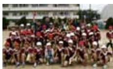
谷津南小、藤崎小に次いで、習志野市では3校目の訪問

6/19(火)、「体育研究校」としても積極的に体育・学校保健に取り組まれている習志野市立屋敷小学校で、フラッグフットボールの授業を行いました。初めてのフラッグ体験を通じて、皆で話し合っって作戦を考えたり、やってみて上手いかなかったことを反省して次に活かしたり、成功を喜び合ったり、変化と成長を感じる貴重な時間を過ごしました。