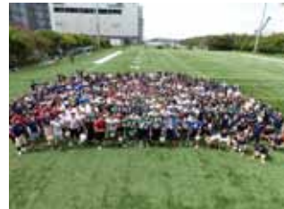
習志野グラウンドでの開催は2年ぶり。29大学、総勢351名が参加しました

7/8(日)、毎夏恒例の大学生対象クリニック「鷗(かもめ)道場」を行いました。オービックシーガルズの選手がメニューを作り、直接指導する場である鷗道場。「自ら何かをつかみとって学んでほしい」という大橋ヘッドコーチのメッセージのもと、ポジション別に分かれての指導を行いました。道場終了後も熱心な個別指導が続き、私たちにとっても、ファンダメンタルの重要性を再認識できた一日となりました。