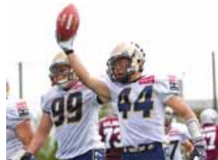
試合の流れを変えたインターセプトでMVP初受賞のLB#44藤藤

先制点を与えるも、ディフェンス陣が流れを断ち切り、その後は相手にベースを与えずオフェンスも効果的に得点に加え、点を取り合う展開の中、勝利を収めました。